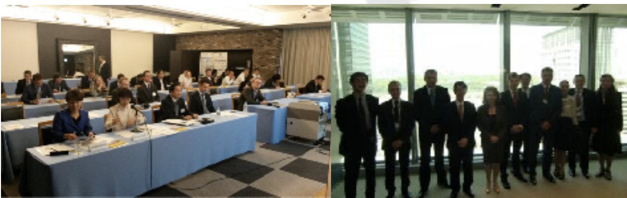
Инвестиционный семинар в Японии (апрель 2014) https://www.indparks.ru/press/news/1259/