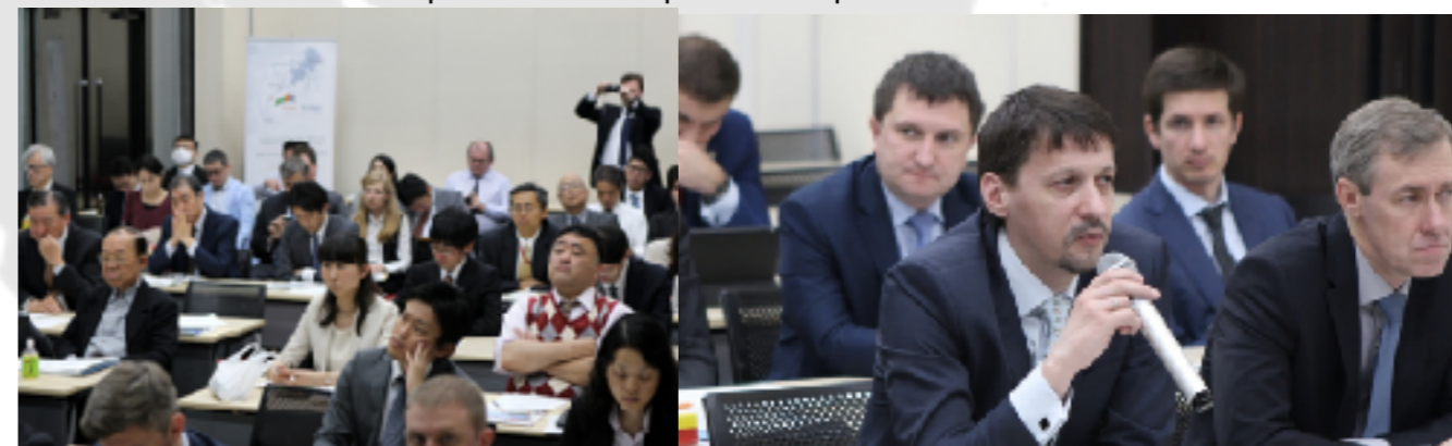
Инвестиционный семинар в Японии (апрель 2015) http://www.indparks.ru/press/news/1807/