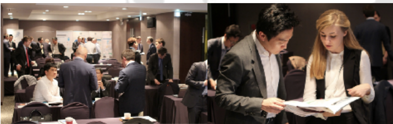
Инвестиционный семинар в Корее (апрель 2015) http://www.indparks.ru/press/news/1799/