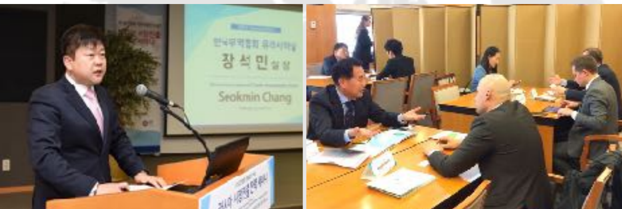
Инвестиционный семинар в Корее (март 2016) http://www.indparks.ru/press/news/2691/