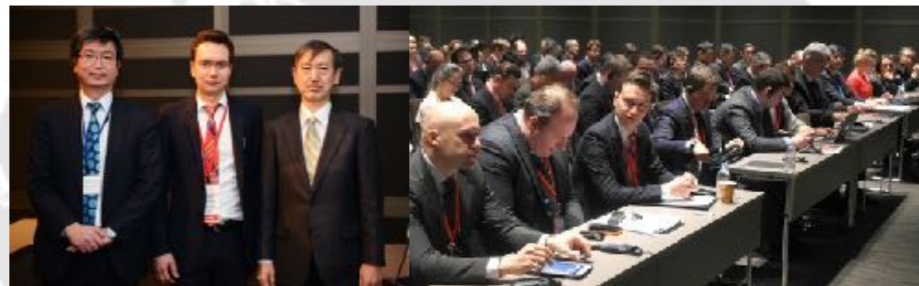
Инвестиционный семинар в Японии (март 2016) http://www.indparks.ru/press/news/2689/